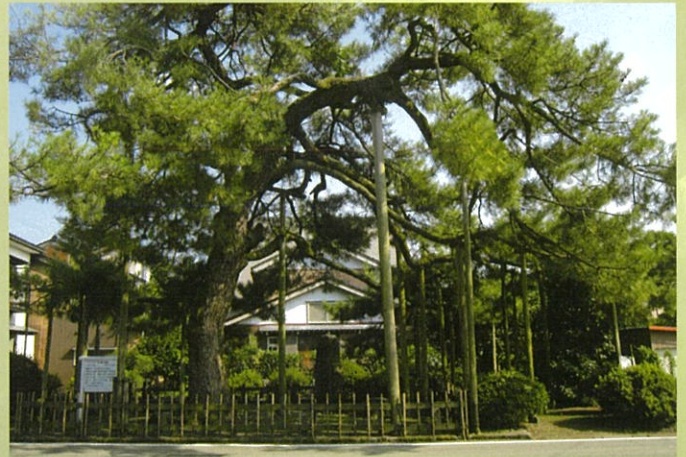
巴塚の松(南砺市福光)