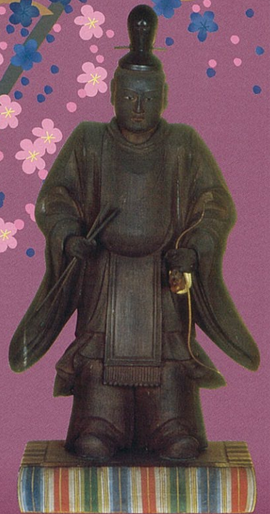
木曾義仲立像(義仲寺蔵)